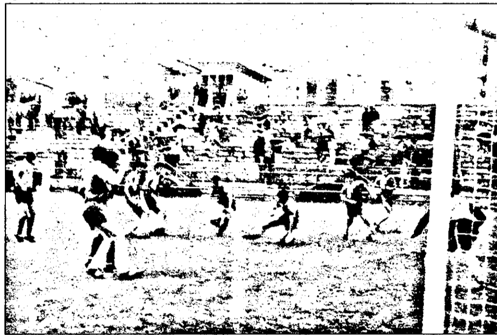
Un nou atac al jucătorilor echipei Aris produce panică în careul advers. (F.C. Aris Arad - Minerul Cavnic 3-1).