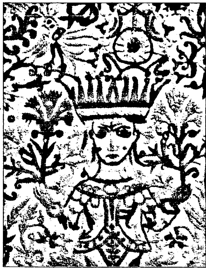
Broderie din Creta secolului al XVIII-lea. Arta broderiei are originea în Asia și a înflorit în Europa de mai multe secole.