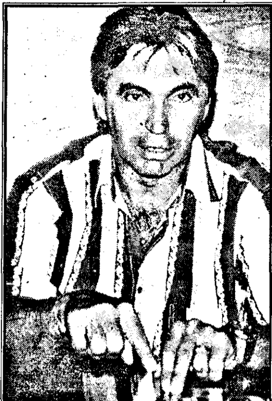
renunțat ușor la Grad. De ce?

- Nu avem un libero la echipă și totuși s-a