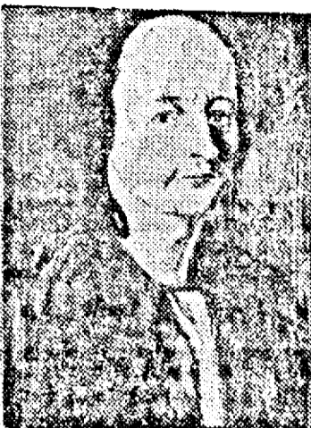
REGELE MIHAIL I