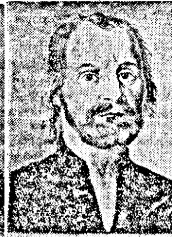
REGELE CAROL I

Azi, 155 ani... Atâta vreme n'pînîntă dela frângerea pe roată a mucoșilor Horia și Cloșca, pietre de hotar între două concepții sociale, început de luptă pentru dor național și primele lui jertfe... Atâția ani încheiați de când o răsvrătire a stăvilii, trecător, mersul unei istorii scrisă cu sânge și lacrimi!..