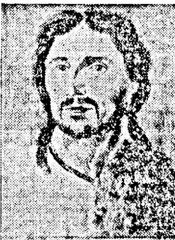
REGELE FERDINAND I