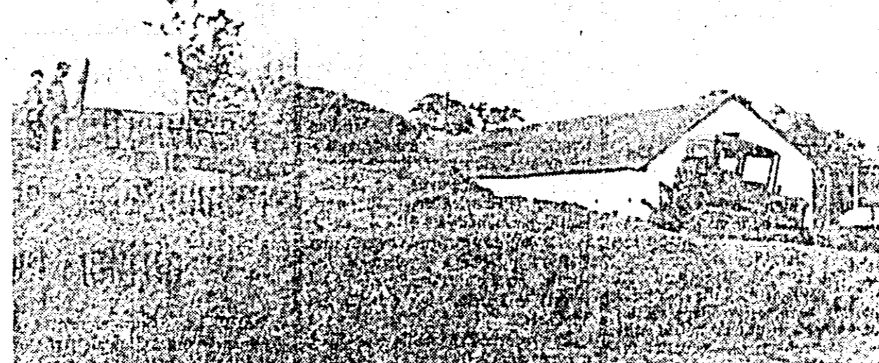
La I.A.S. „Știința” se însilozează în acest an o mare cantitate de nutrețuri verzi. Imaginea de mai sus înfățișează un aspect al acestei importante acțiuni.

În ceea ce privește aplicarea îngrășămintelor cu fosfor, ele au dat mai bune rezultate cind s-au încorporat în sol odată cu arătura de vară sau cu arătura de însemnătare. Nu este recomandabil să este bine să se evite administrarea îngrășămintelor cu fosfor sub disc sau înaintea grăpatului, așa cum s-a mai practicat de unele unități îngrășămintele cu azot pot fi aplicate cu bune rezultate atît înaintea semănăturii, odată cu arătura, sub disc sau după semănat în ferestrele iernii, ori primăvara devreme. În zona noastră unde datorită precipitațiilor abundente din timpul iernii are loc o levigare intensă a azotului, este recomandabil ca doza de îngrășămintele cu azot să fie dată fracționată, jumătate în toamnă și jumătate primăvara devreme. În condițiile specifice din toamna