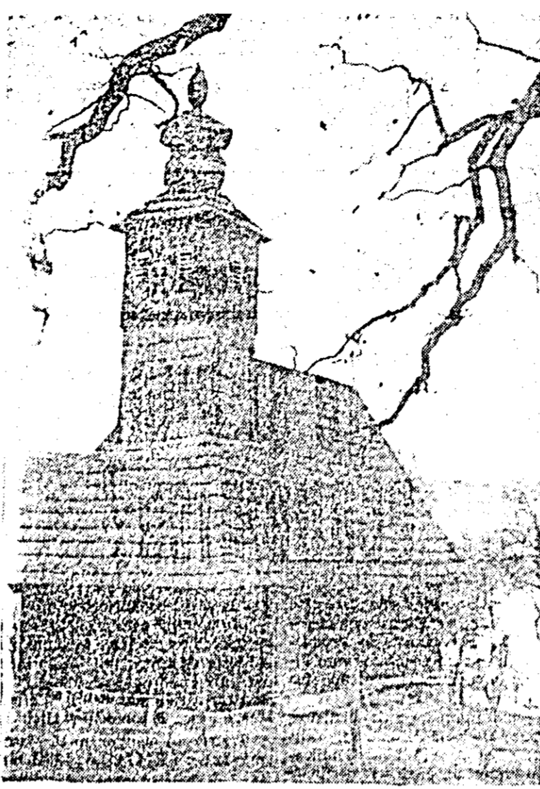
Biserica din Iemn din Vidra — monument istoric. Cîndva, în clopotnița acesteia se ascundeau haiducii, așa după cum glăsele povestirile și legendele acestor locuri de pe Crișul Alb.