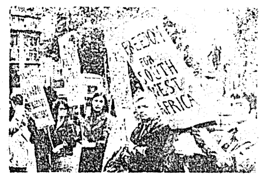
ANGLIA — Aspect de la o demonstrație la Londra în care se protestează împotriva sentinței de condamnare a închisoare pe viață a celui negru din Namibia de către regimul rasist din R.S.A. Al șaselea negru judecat a fost condamnat la 18 ani închisoare. Pe pancartele pe care le poartă demonstranții se poate citi: „Libertate pentru sud-vestul Africii!”

În aceeași zi, președintele SUA a avut convorbiri și cu Angie Brooks, președinta Adunării Generale.