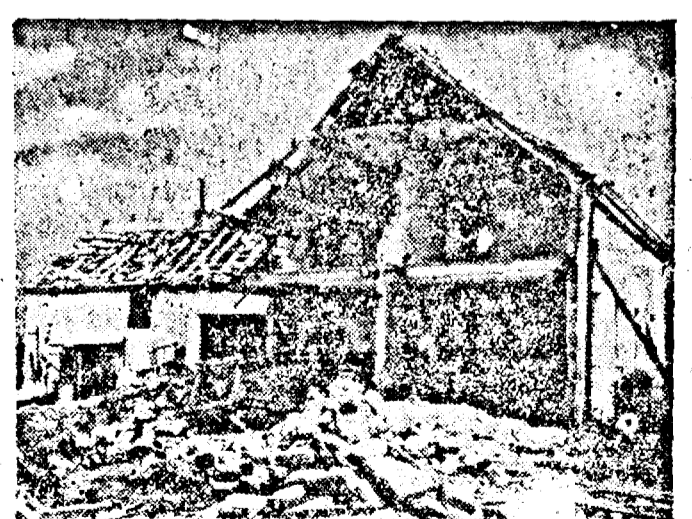
(Stânga) Mareșalul Reichului Hermann Göring conduce personal operațiunile aeriene împotriva insulelor Britanice. Iată-l într'o călătorie de inspecție. — (Mijloc) Avioane de vânătoare italiene se pregătesc de decolare într'o misiune de supraveghere a coastelor și de protecție a formațiilor proprii de bombardament. — (Dreapta) Bombardamentele aeriene englez, făcute la întâmplare în Germania, produc mereu stricăciuni obiectivelor nemilitare. Iată ruinele unor locuințe muncitorești.