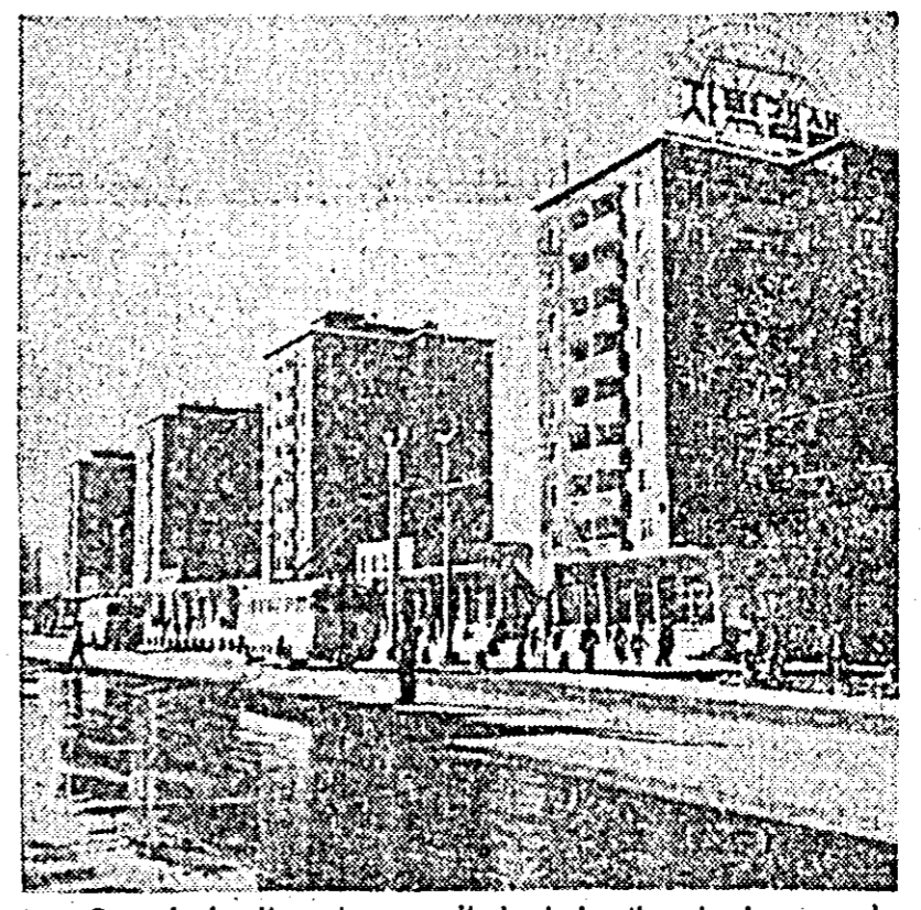
Case de locuit pentru muncitorii și funcționarii în orașul Phenian — R. P. D. Coreeană.

ROMA 6. — Correspondentul Agerpres, Octavian Păizer, transmite: În celebra „Grotta Azzurra”, din insula Capri, denumită astfel datorită refracției luminii, care colorează peștera în albastru, scafandrii au descoperit, cu mai mult timp în urmă, la o adîncime de aproape 40 de m sub apele Mediteranei, o statuie antică de marmură. Statuia, reprezentînd un triton, datează de la începutul erei noastre, cînd, după mărturiile scriitorilor latini Suetoniu și Tacit, această frumoasă insulă era locul preferat de odihnă al împăraților romani August și Tiberiu.