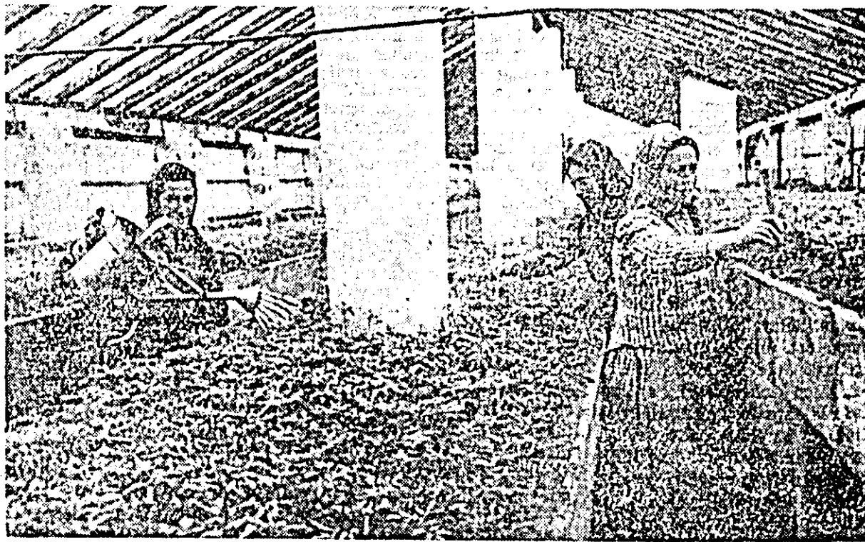
În serele colectivităților din Vladimirescu se dă multă atenție în aceste zile îngrijirii răsadurilor. ÎN CLIȘEU: colectivistele brigăzii legumicole execută plivitul și udatul răsadurilor pentru a le asigura buna creștere.

— SUPRAFAȚA DE RĂSADNIȚE pentru asigurarea spațiului necesar de producere a legumelor a fost depășită față de plan cu 32%. Plină de curînd s-au însemnănat și repicat diferite culturi de legume pe o suprafață de cca 72.000 metri pătrați din care numai cu roșii peste 18.000 metri pătrați. — DE MULT INTERES se bucură organizarea rațională a lucrărilor în răsadnițe și în câmp, precum și efectuarea lor la timp și în bune condiții la gospodăriile colective din Zădăreni, Zimanduz, Macea, Curtici și altele care obțin bune rezultate în sectorul legumicol. În aceste gospodării colective s-au contractat și importante cantități de legume ce vor fi valorificate cu statul.