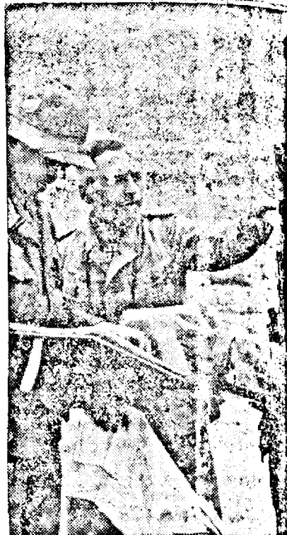
Conferință între comandanții germani pe frontul din nordul

Zagreb, 15. (Rador) În apropiere de Zarsak un autobus care a transportat 26 elevi de liceu și 6 profesori din cauze până acum nestabilite a căzut în fluviul Vrbas. Până în prezent au fost scoase 11 cadavre și 15 elevi grav răniți.