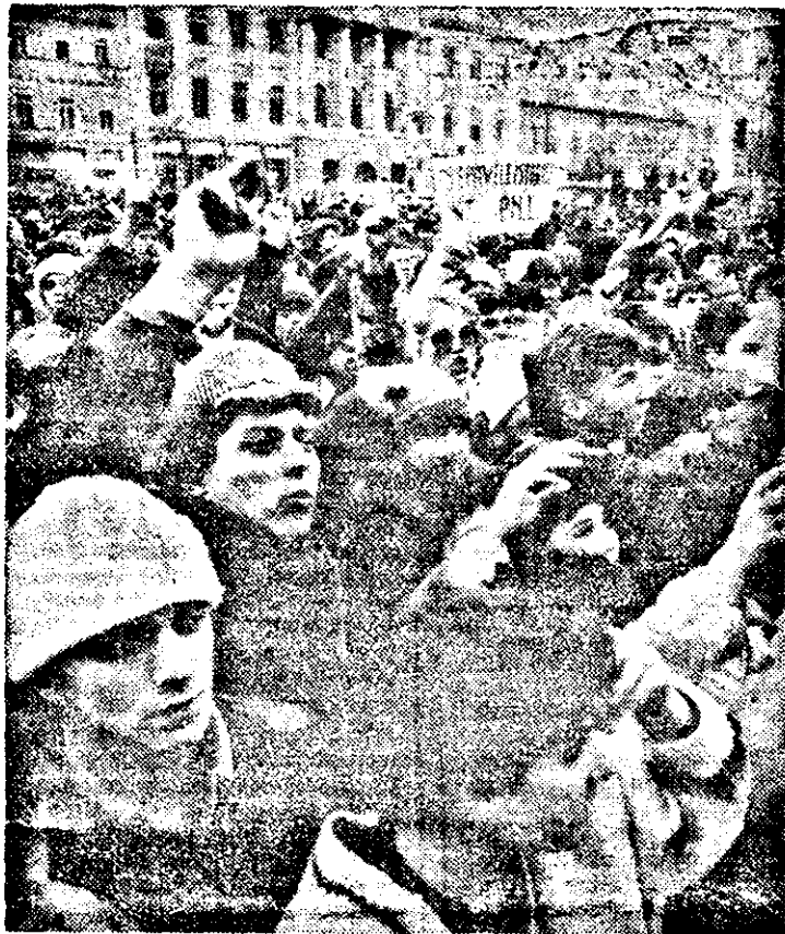
Imagine document: Arad, 29 ianuarie 1990, în Piața centrală a municipiului.