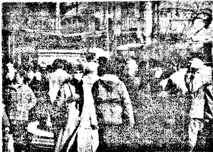
Setea de informații...

Tocmai de aceea, îmi permit să mai întreb: oare n-ar trebui mai bine să facem curățenie printre noi și să-i infierăm legal pe toți aceia care — nici înainte de revoluție, nici acum după — nu s-au deprins și nu se deprind cu munca cinstită, creatoare, pentru că nu le-a plăcut niciodată acest lucru, deretare acum împrăstie în lume zănie, fel de fel de avonuri, ori se erizează în martiri, oropsiți, nevoiași, îndreptății la fel și fel de ajutoare, mai ales sosite de peste hotare? Adică, de ce ei au numai drepturi, dar obligații — și în primul rînd aceea de a munci cinstit, de a fi utili societății românești supusă acum la grele încercări — nu le au?