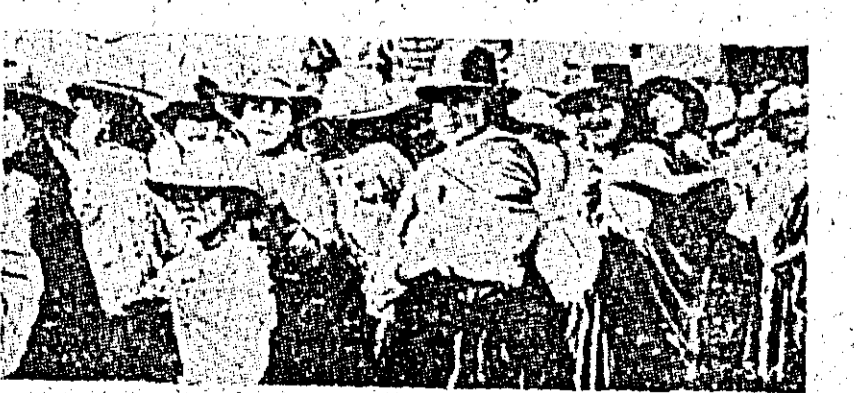
La Quito, capitala Ecuadorului: aspect de la o demonstrație a țărăncilor pentru reforma agrară.

Agencia France Presse anunțește că în ajun guvernul tunisian și-a rechemat ambasadorul din Algeria. Guvernul tunisian a declarat că autoritățile algeriene au acordat oziul unui din participanții la compoziția care a avut drept scop asasinarea președintelui Bourghiba și răsturnarea guvernului.