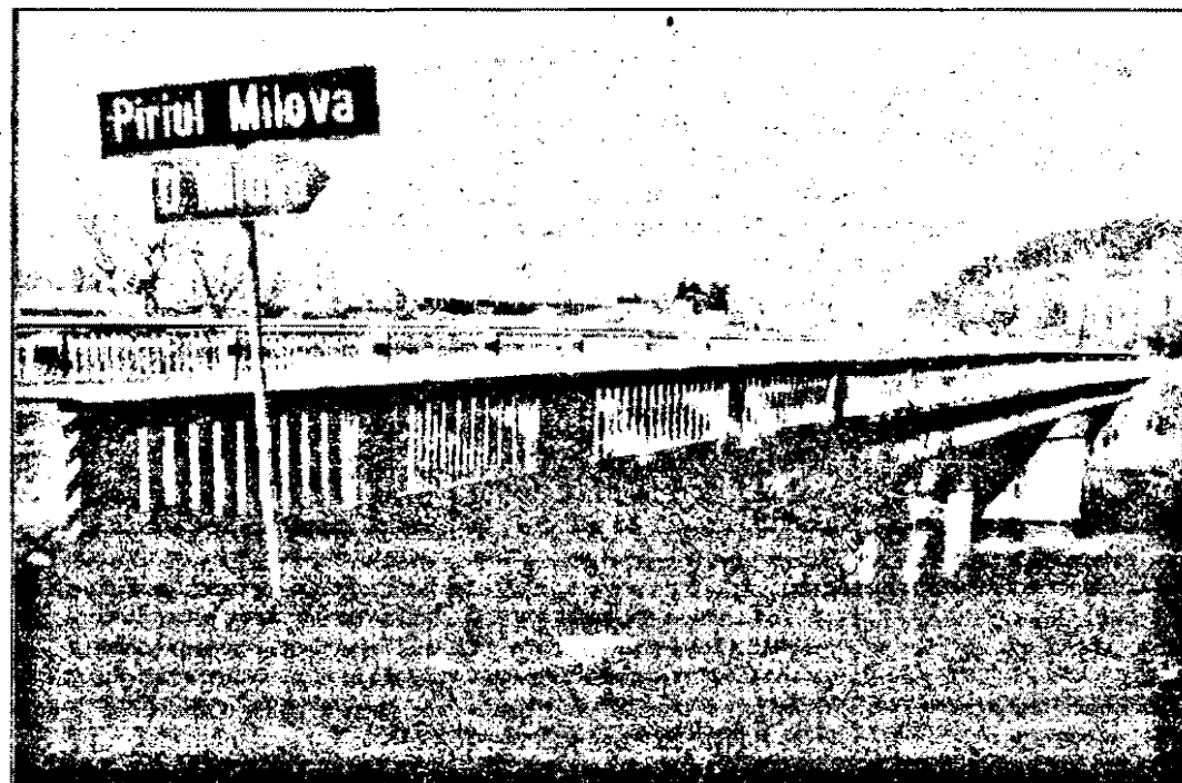
Podul peste pârâul Milova, unul dintre podurile care vor fi reabilitate și modernizate în conformitate cu standardele europene.

Aceasta generează creșterea poluării, atât atmosferice cât și fonice, aglomerarea traficului rutier, precum și sporirea timpului de parcurs pe raza orașului nostru. Dacă totul va decurge conform programărilor, luna aprilie a anului 1996 va rezolva această problemă, prin darea în folosință a noii centuri rutiere ocolitoare a municipiului Arad, cuprinsă în planul de reabilitare a D.N. 7. Această centură va începe la intrarea în municipiul Arad, dinspre localitatea Vladimirescu (stația PECO Micalaca) și se va încheia în zona filodromului, la ieșirea din Arad spre Pecica. Centura va avea o lungime de 13,179 km și va cuprinde trei sectoare : sectorul A (5,262 km) între PECO Micalaca și intersecția cu D.N. 79 spre Oradea; sectorul B (6,306 km) între D.N. 79 - cartierul Gai; sectorul C (1,611 km) cuprins între Gai și D.N. 7 (zona