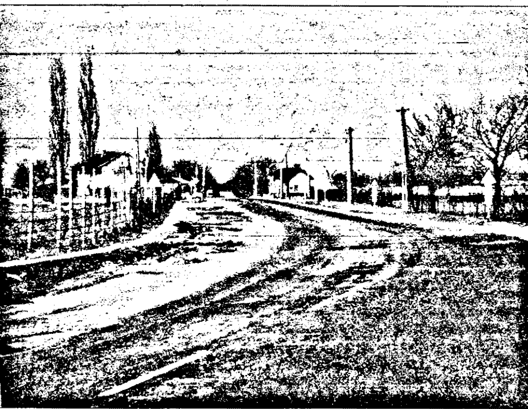
La Păuliș se va construi un pasaj de 400 m lungime, 8 m înălțime peste calea ferată. Vor fi eliminate astfel staționările la barieră.

Unul dintre marile neajunsuri ale circulației pe raza municipiului Arad îl constituie, lipsa unei centuri rutiere ocolitoare care să devieze circulația tirurilor, a autovehiculelor de mare tonaj, în afara orașului. Aceasta cu atât mai mult cu cât D.N.7 cuprinde un tronson de aproximativ 10 km în interiorul municipiului Arad.