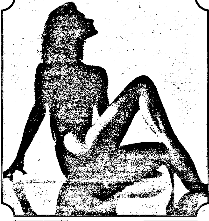
Și totuși se mai poartă pantofi... cu cui.