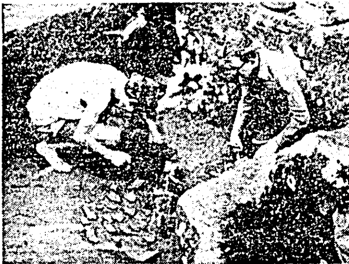
Arheologii de la Muzeul județean în activitate.