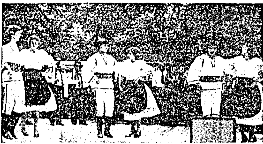
Echipa de dansuri a Casei orașenești de cultură din Lipova, o formație care a înregistrat în ultima perioadă de timp frumoase succese.