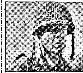
PRO 7-0,15 Marele roșu - f.avent.SUA 1978