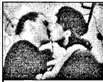
PRO7-21,15 Abisul - f.act. Anglia-Norvegia 1989

6,28 Prezentarea programului 6,30 Viața satului 6,50 Jurnal regional 7,00 Magazin matinal. Din cuprins: 7,01 Știri 7,40 Reuters - jurnal economic 7,55 Povesti 8,00 Magazin informativ 10,00-13,00 Magazin. Din cuprins: 10,30 Riviera - s. 11,30 Dallas - s.SUA: Sentința 13,00 Știri 13,05 Magazin economic 13,55 Teletext 14,00 Heifetz - doc.SUA 15,05 Gaguri clasice 15,15 Viața satului 15,35 Globus - s.maghiar V/I 16,35 Curs de limbă engleză 17,00 Știri, meteo 17,05 Afaceri 17,30 Domnișoara - s.Brazilia 170/8 18,00 Emisiunea vârstnicilor 18,30 Informații utile 18,40 Fereastră - mag.informativ - supliment 19,00 Fereastră - magazin informativ 20,00 Telesport 20,10 Poveste pentru copii 20,30 Telematinal