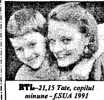
RTL-21,15 Tate, copilul minune - f.SUA 1991

10,05 Cum ieși din Galaxie, pe stân-ga - f.sf.Australia 10,35 Tarzan - s.SUA 11,05 Zorro - s.SUA 11,30 Lumea jocurilor video 12,00 Super-magazin 13,00 Asadar - forum politic