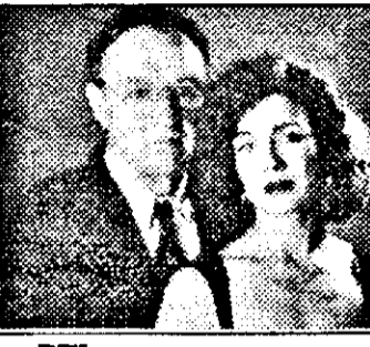
RUL-23,00 La fir de păr - f.pol.SUA 1990

11,30 Vecinii - s.Australia 12,00 Tânăr și fără odihnă - s.SUA 12,55 Riscă! - conc.tv 13,30 Sub soarele Californiei - s. SUA 14,25 Falcon Crest - s.SUA