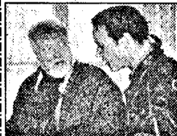
SAT I-21,15 Inspectorul König - s. pol. germ.

6,30 Viața satului 6,50 Jurnal regional 7,00 Magazin matinal 7,01 Stiri 7,40 Reuters - jurnal economic 7,55 Povesti 8,00 Magazin informativ 10,00-13,00 Magazin. Din cuprins: 10,30 Riviera - s. 11,30 Okavango, inima sălbăticiei - s.SUA, XIII/8 13,00 Stiri 13,05 Magazin economic 13,55 Teletext 15,35 Prezentarea programului 15,40 Viața satului - rel. 16,00 Cultura cu multiple fete - doc.am.XXI/16 : Magie și credință 16,30 Meditații - fizică-matematică 17,00 Stiri, meteo 17,05 Concurs tv 17,30 Domnișoara - serial Brazilia 17,56 18,10 Calendarium - magazin informativ 18,40 Să vorbim corect