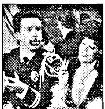
PRO 7-21,15 Police Academy 3 - comed. SUA

8,30 Hello, Austria - magazin 9,00 Știri ITN 9,30 Jurnal european - mag. 10,00 Video moda 10,30 X-Press Entertainment 11,00 Rolonda - talkshow 12,00 Super shop 13,00 Magazin informativ NBC 13,30 Financial Times 14,00 Azi - magazin informativ 15,00 Sport-magazin : motociclism 16,00 Golf 17,00 Auto - magazin 18,00 Motociclism 20,00 Știri ITN 20,30 Ushuaia - mag. 21,30 Start - motosport - magazin