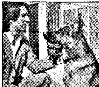
SAT I-21,15 Comisarul Rex - nou s. pol. germ.