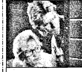
SAT 1-16,55 McGyver - s.am.

8,15 Lumea afacerilor 8,45 Buletin financiar 9,00 Stiri ITN 9,15 Afaceri - magazin 9,30 Ediție internă 10,00 Super shop 11,00 Rolonda show 13,30 Financial Times 14,00 Azi - reportaje 15,00 Roata banilor - Wall Street Journal 16,00 Magazin de vacanță 17,00 Visuri de zbor 18,00 Amintiri de ieri și azi 18,30 Financial Times 19,00 Azi - magazin informativ 20,00 Stiri ITN 20,30 Maestrii frumuseții - mag.de modă