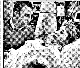
RTL-21,15 Copilul gravidei moarte - f. germ.

6,50 Desene animate 8,10 Flipper - s.am.: Flipper vorbește 8,40 Familia Walton - s.am.: Schimburi 9,35 Micuța noastră fermă - s.am. 10,30 Regele din Hawaii - f. SUA 1962 cu Charlton Heston 12,30 Compania celor trei - s.am.: Gaură în perete