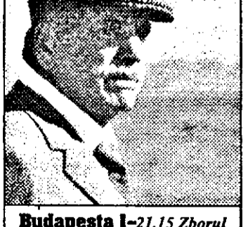
Budapesta I-21,15 Zborul vulturilor - f.tv.SUA

6,40 - 12,45 Des.anim. 12,45 Batman - s.SUA: Pe aripi în închisoare 1-2 13,45 Parker Lewis, spaima școlii - s.am.1990