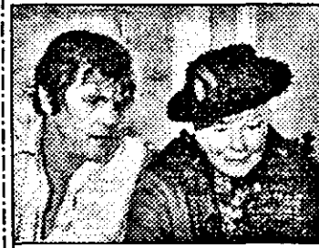
PRO 7-2,45 Soluția finală - comed.SUA, 1984

7,38 Prezentarea programului 7,40 Magazinul satului 8,25 Coroană vrăjită - d.a. 8,50 Cuvântul Domnului 8,55 Abecedar calculatoare 9,30 Magaz. distractiv duminical 12,00 Boutique muzical 13,00 Teletext, meteo 13,05 Secolul al XXI-lea - Viața în afara Pământului 13,35 Des.anim. 13,50 Domnișoara - s.Brazilia, 1705-8 rel. 15,45 Religie 16,40 Delta - magazin științific 17,10 Religie 17,30 Program Walt Disney - des.anim., Zorro - s.SUA 54/47 18,35 Cabaret - emis.distractivă 19,25 Roata norocului 19,55 Des.anim.