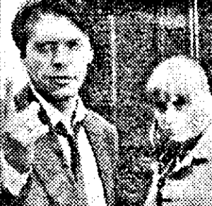
SAT I-21,15 Adevărul ce ucide - f.tv. Germania

9,00 Stiri ITN 9,15 Bursa SUA 9,30 Jurnal NBC 10,00 Super shop 11,00 Rolonda Waits show 12,00 Riviera show 12,30 Magazin politic SUA 13,00 Magazin economic mondial 13,30 Financial Times 14,00 Azi - magazin informativ 14,30 Financial Times 15,00 Azi - magazin informativ 16,00 Roata banilor - informații de pe Wall Street 18,30 Financial Times 19,00 Azi - magazin informativ 20,00 Stiri ITN 20,30 Golf - Cupa Heineken 21,30 Dateline - magazin politic: Căderea zidului Berlinului 22,30 Ediție internă 23,00 Stiri ITN