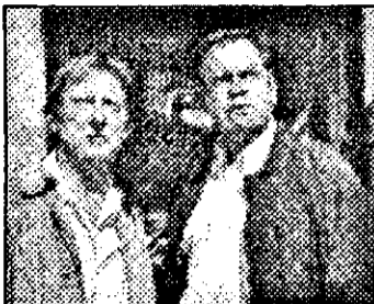
RTL-22,15 În numele legii - s.pol.germ.

12,00 Tânăr și fără odihnă - s.am.: Ziua următoare 12,55: 5x5 - conc.tv 13,30 Sub soarele Californiei - s.am.: Probleme vechi și noi 14,30 Falcon Crest - s.am.: Lecția