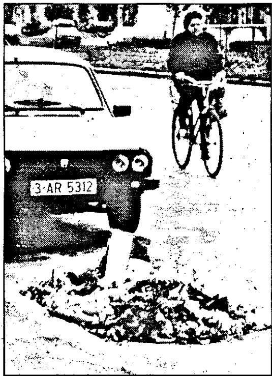
De două săptămâni, această grămadă de gunoi „parcată” pe carosabil în Cartierul Aurel Vlaicu așteaptă să fie văzută de primul gospodar al orașului. E-hei, dacă ar fi fost în fața magazinului „Erotica”, ce dispoziție ar mai fi tras domn'primar!