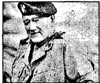
PRO 7-23,10 Beretele verzi - fact.SUA

6,30 Viața satului 6,50 Jurnal regional 7,00 Magazin matinal 7,01 Știri 7,40 Reuters - jurnal economic 7,44 Povesti 8,00 Știri 10,00 Magazin. Din cuprins 10,30 Riviera - s 11,30 Okavango, inima sălbăticiei - s.am. XIII/9 13,00 Știri