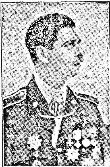
ÖFELSÉGE II. CAROL KIRÁLY

Bucurestiből jelentik: Öfelsége a király rendelettörvényt irt alá, amely a birói karban történt újabb változásokról intézkedik. A változások: kinevezések, áthelyezések, előléptetések, amelyek között a következők szerepelnek: A bucaresti-i ítélőtábla főügyészévé Ti-