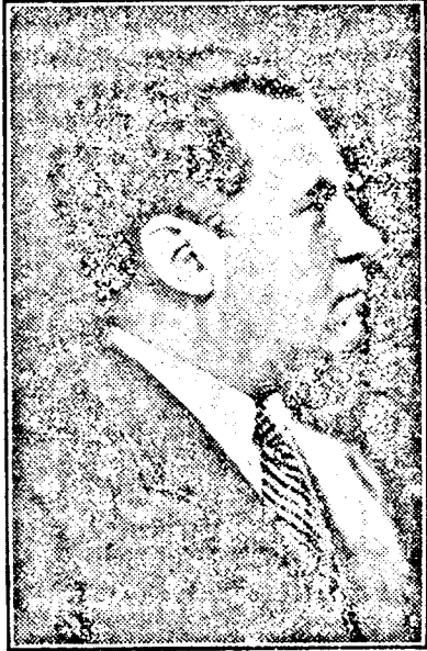
VICTOR IAMANDI, a gyengélkedő igazságügyminiszter

A kormány összes tagjai az államutkárokat is beleértve a gyengélkedő Iamandi kivételével, tegnap este tanácskozást tartottak Miron patriarcha elnökletével.