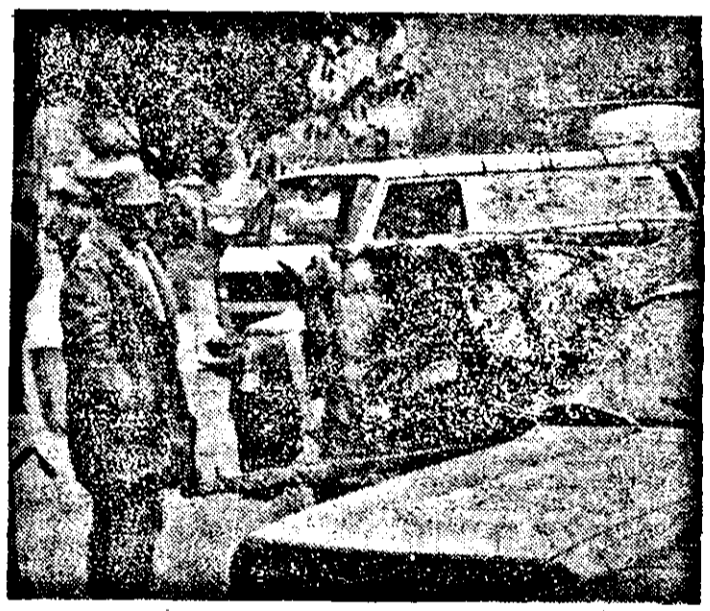
La parcare, drepturi egale.