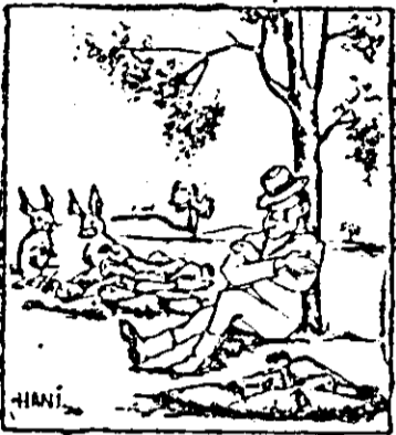
— Să profităm! Fii liniștiți, are somnul greu.

Pe alocuri, sâmbetea de zahăr recoltată nu este transportată urgent de pe câmp.