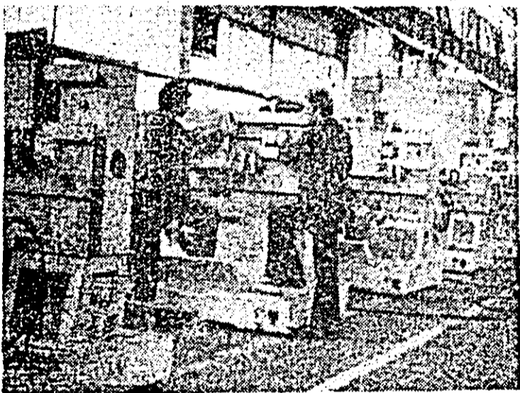
Aspect de muncă în secția montaj a întreprinderii de mașini-unelte Arad.