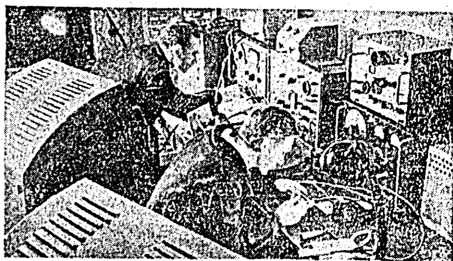
IN CLIȘEU: studierea semiconductorilor la Institutul Academiei de Științe a U.R.S.S.

Semiconductorii — mici cristale din germaniu, siliciu și alte materiale — îndeplinesc cu succes funcțiile lămpilor de radio: ei servesc ca redresoare, amplificatoare, generează unde de radio.