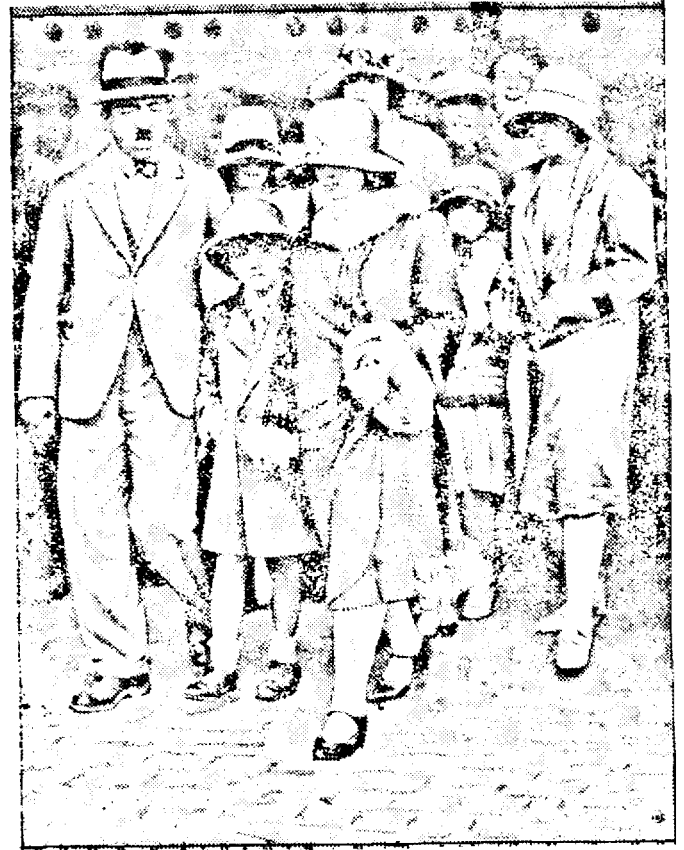
Cliseul nostru arată pe fostul rege Amanulah cu soția și 7 copii sosirea în Marsilia.

Se spune că fostul suveran este hotărât să facă agricultură.