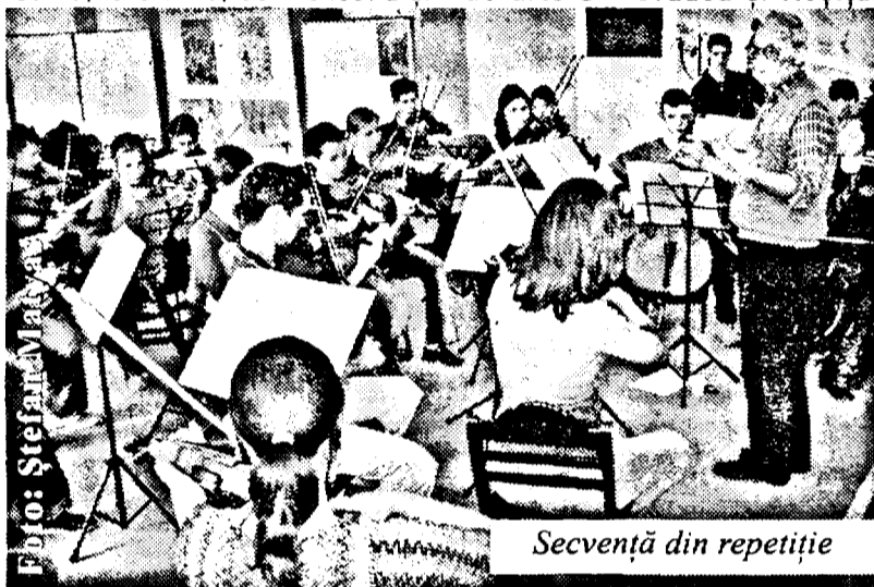
Secvență din repetiție

Între colaboratori trebuie să amintim și ansamblul coral al liceului de arte din Oradea și Reșița.