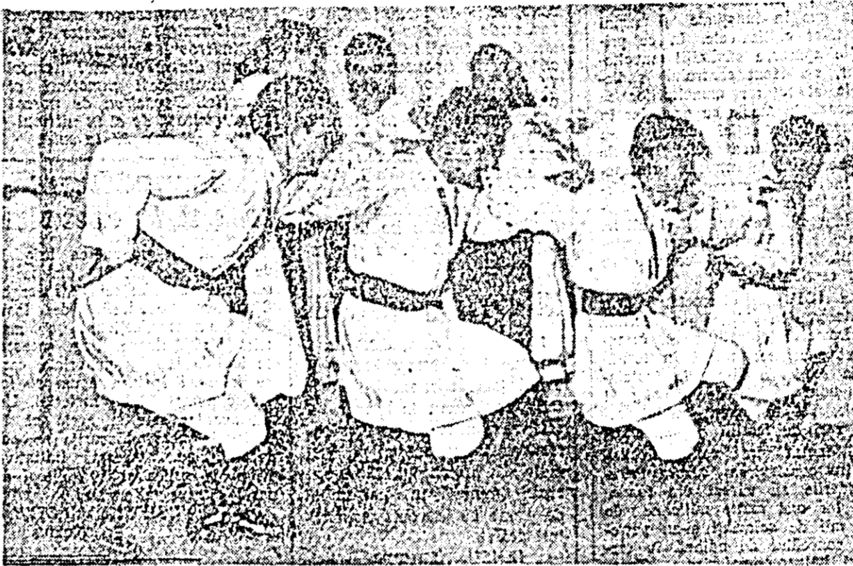
Formația de dansuri din Selmec interpretind o suită de dansuri bănățene.