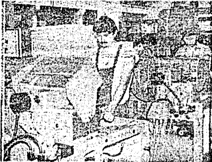
Întreprinderea de mașini-unelte. Aspect de muncă în secția montaj.

Mobilizându-se exemplar pentru a-și îndeplini în cele mai bune condiții sarcinile de plan pe acest an — an hotărâtor al actualului cincinal — colectivul de oameni ai muncii de la întreprinderea pentru producerea nutreturilor combinate din Arad a realizat în devans indicatorii planului pe opt luni, preluând-se realizarea unei producții marfă suplimentare, față de sarcina de plan din perioada mai sus menționată, în valoare de 39 750 000 lei. În acest context, se cuvine evidențiat faptul că întregul spor de producție a fost obținut pe seama creșterii productivității muncii, care este mai mare cu 27 la sută față de nivelul stabilit pentru opt luni.