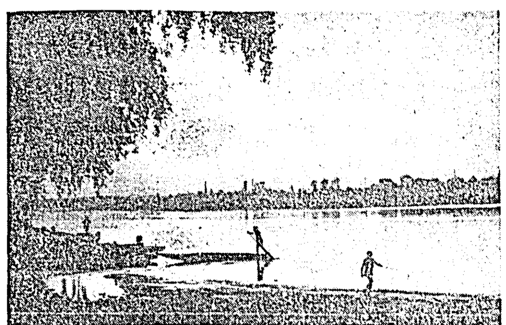
„Seară pe Mureș”.