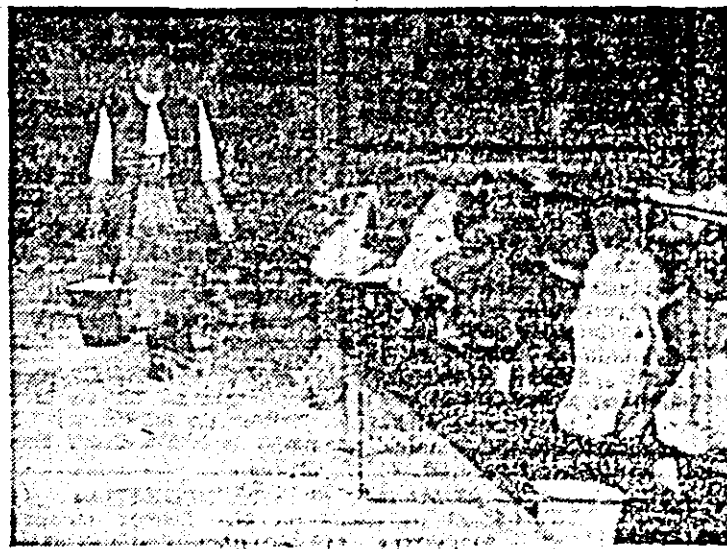
Cu gălețile de apă, așa se face, încă adăpatul vacilor, în grajd modernizat, la C.A.P. Pădureni.

Condiții bune de creștere și furajare s-au constatat și la cooperativa agricolă din Chi-