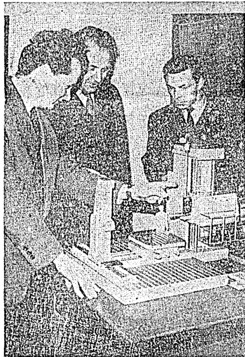
Fabrica de mașini-unelte din Dabrowa Górnicza (RP Polonia) a realizat un nou prototip de mașină de găurit-frezat. ÎN FOTOGRAFIE: prototipul mașinii și constructorii ei.

amplasarea de arme nucleare pe teritoriul statului canadian Quebec împotriva voinței poporului. Moțiunea a fost respinsă cu ajutorul majorității liberale și a conservatorilor din Camera Comunelor. Partidul conservator, deși în opoziție, s-a pronunțat împotriva acestei moțiuni.