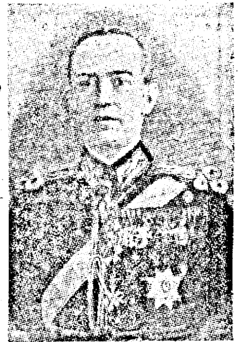
D. general ION ANTONESCU, președintele Consiliului de miniștri.

Proclamația d-lui general Ion Antonescu șeful Statului și președinte al Consiliului de miniștri