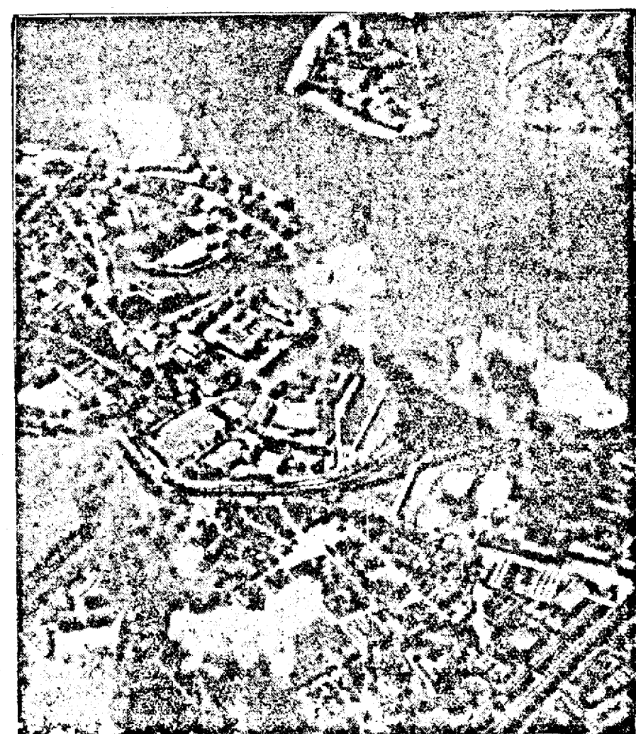
Bombardarea portului englez Portsmouth de aviația germană

Făcând această jertfă pentru salva- rea Patriei, înalt cea mai caldă rugă- ciune ca ea să-I fie cât mai folositoare. Lăsând poporului Meu, pe scumpul Meu fiu, rog pe toți Românii să-L în- conjoare cu cea mai caldă și mai desăvâr- șită credință și dragoste, ca să poată găsi în ele, reazămul de care are nevoie greaua-I răspundere ce de azi înainte a- pasă asupra umerilor Lui frazezi. Țara mea să fie păzită de Dumnezeu părinților noștri, care să-i hărăzească un cât mai falnic viitor. Trăiască România! CAROL R. București, 6 Septembrie 1940.