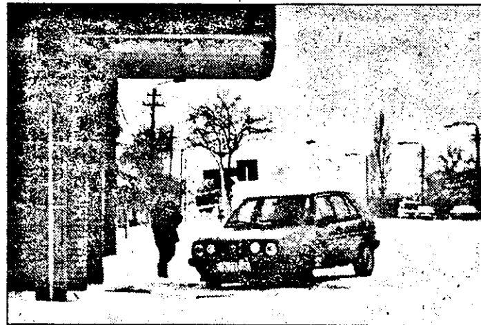
Pe Calea Timișorii, practic, nu puteai să frânezi sau să pornești fără a derapa din cauza zăpezii bătătorite.

până la ora zece n-avem unde găsi utilaje pentru deszăpezire. În acest timp, arădenii cad pe zăpadă, se ridică și merg mai departe bolborosind ceva la adresa Primăriei. N-am reținut exact expresiile, dar chiar și dacă le rețineam, din pudoare nu le-am fi reproduș. Un