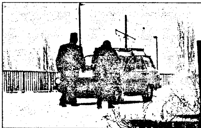
Pe podul de la Micălaca, Daciile urcau doar împinse de pasageri.

Ieri, până la orele 10,00, nici un utilaj nu a ieșit la deszăpezire. De data asta nici măcar în fața Primăriei. Tocmai