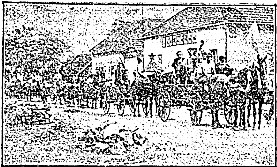
Căruțele încărcate cu rodul muncii se îndreaptă spre casele colectiviștilor.

Magazinerul gospodăriei colective are acum mult de lucru. În cîntecele vesele ale orchestrei colectiviștilor și încarcă produsele. Șirul căruțelor încărcate cu rod crește mereu. Cîțiva țărani muncitori cu gospodării individuale nu se desprind de lângă cîntar. Privesc cînd la grîul din magazie, cînd la colectiviștii ce-și încarcă pe căruțe rodul muncii. Colectiviștii Ra-