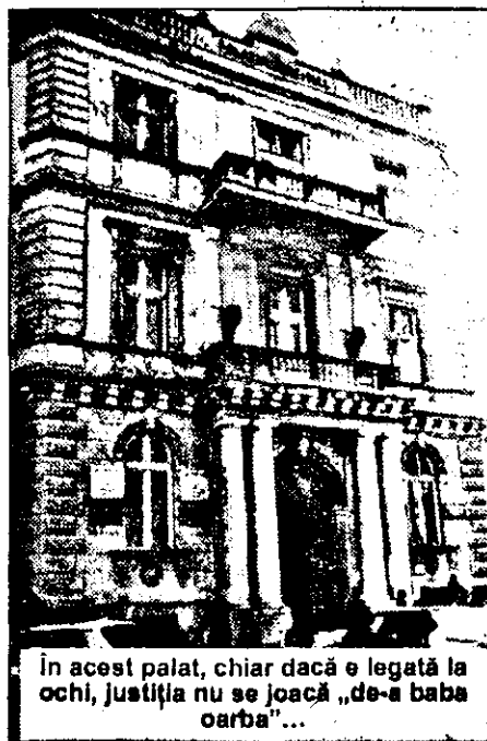
În acest palat, chiar dacă e legată la ochi, justiția nu se joacă „de-a baba oarba”...

încheiem fără a-l întreba pe dl judecător Horea Oprean cum se recrează. „În puținul timp pe care-l am, pentru că vreau să mai scriu niste cărți și curând urmează să dau doctoratul în drept internațional public, joc