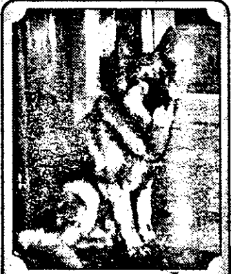
Cu mulțumiri, celor care m-au ajutat la găsierea Ciobănescului German din imagine.