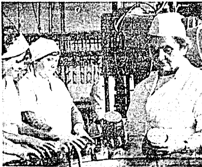
În plin sezon de conservare a legumelor la I.P.L.L.F. „Relacerea”.