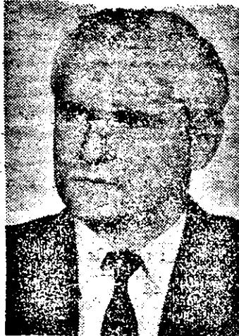
Foto: Născut în martie 1954 în localitatea Macea, A absolvit Facultatea de Științe Economice. Este director al Societății comerciale „C. Ardelean” S.R.L. Este consilier al Consiliului județean Arad.