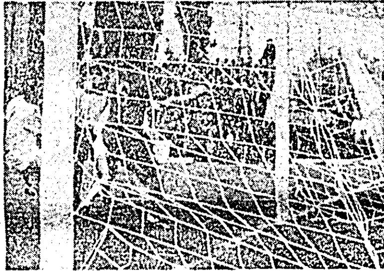
O fază din meciul U.T.A. - Steaua.