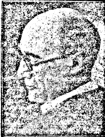
André Gide, a híres francia író november 21-én tölti be 60-ik életévét.