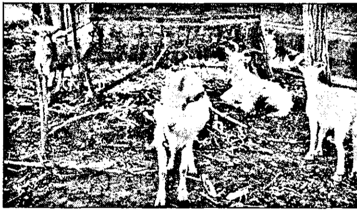
Se pare că a tine pe lângă casa (nu neapărat în fața casei, pe stradă, cum se întâmplă în cazul de față, din imagine) câte o capră, două, trei intră din nou în „mod”. Poate ca astfel laptele lor, indicat mai ales pentru cei care suferă de plămâni, va ajunge la cât mai mulți arădeni.