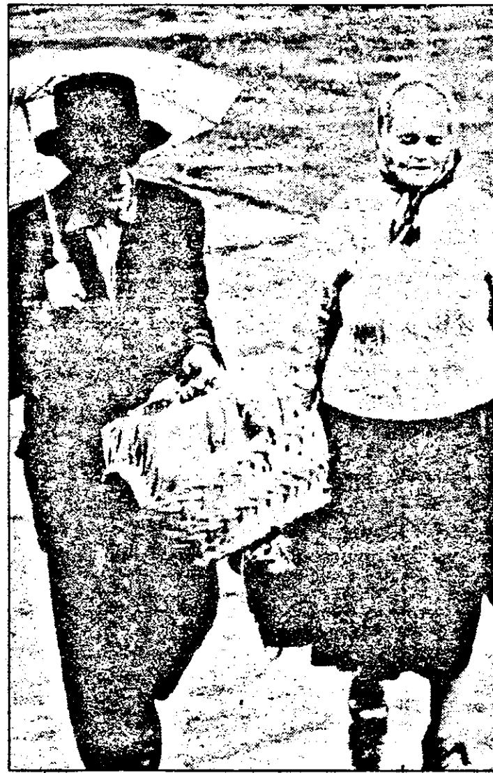
Odată, încăpeam amândoi sub o umbrelă...

La Filarmonica de Stat Arad AZI, ÎNCEPE CEA DE-A 104-A STAGIUNE