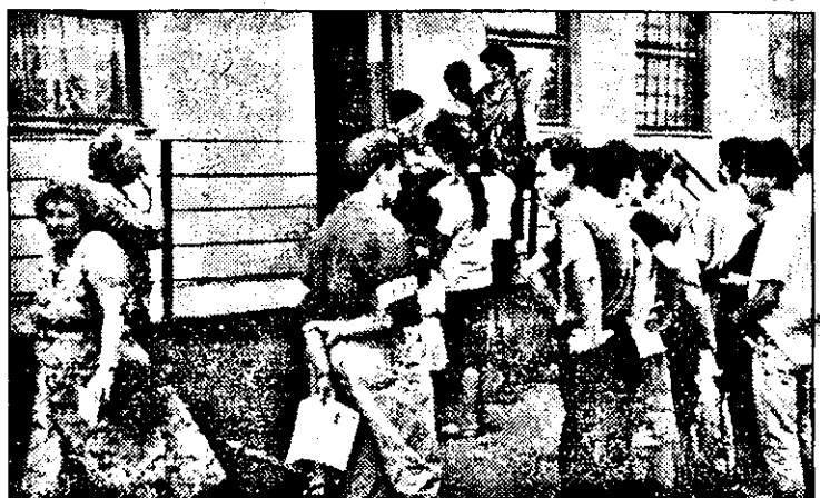
Numărul ghișecilor unde răbdarea cetățenilor este pusă la încercare s-a mărit considerabil odată cu începerea distribuirii cupoanelor de privatizare, pentru ridicarea cărora oamenii sunt nevoiți să piardă ore întregi.