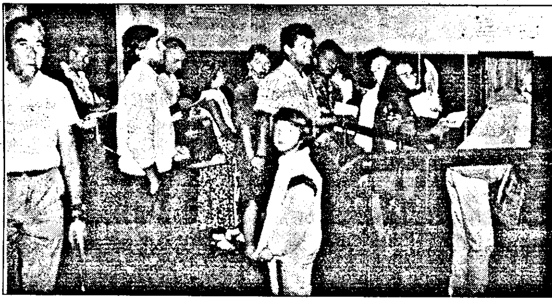
Notariatul de Stat Arad: cozi mari, nervozitate, timp pierdut. Va rezolva apariția notarilor publici această problemă?