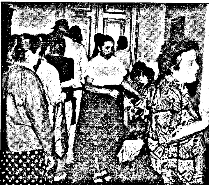
Alt rând, altă „distracție”...