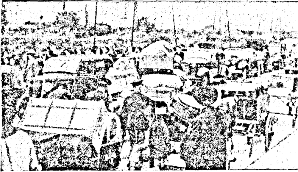
Exodul refugiaților în...