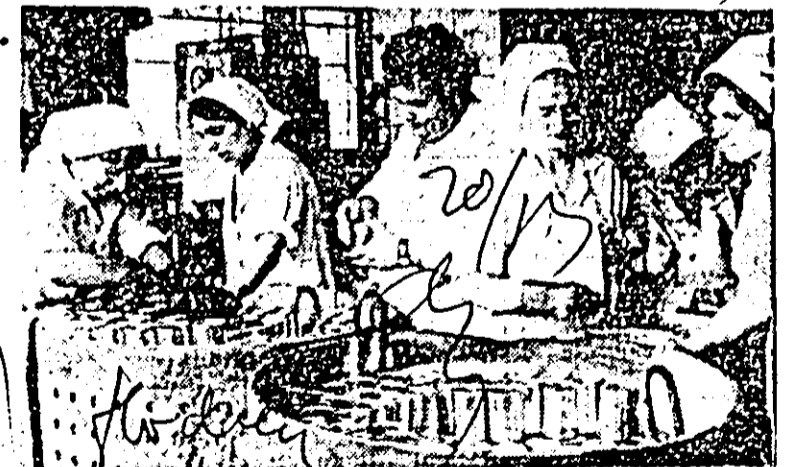
Întreprinderea „Relacerea”. În sectorul mașinilor de închis — de unde vă prezentăm acest instantaneu — se lucrează intens la producția din noua recoltă.