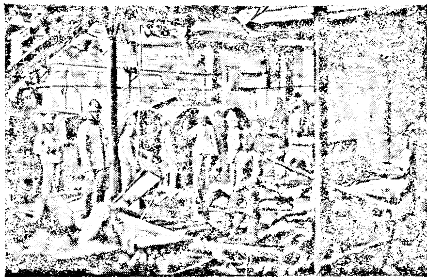
Clișeul nostru arată ravagiile exploziei.

PRESSBURG. — Explozia unui mare butoi de ulei la fabrica de gumă Hörne din Pressburg, după cum am anunțat la timp, a produs mari pagube și numeroase victime omenești. Un mare număr de muncitori și muncitoare au fost grav răniți, dintre cari mare parte au murit în spital.