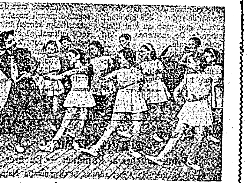
La o lecție de coregrafie, prof. para: dă îndrumări micilor balerine.