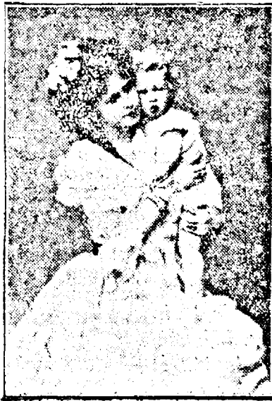
M. S. Regina Maria purtând în brațe pe Prințul Carol la vârsta de un an.

Viața terestră a Reginei Maria a însemnat deci prefața unei alte vieți de mai lungă durată, care va străluci de azi înainte în paginile istoriei universale — unde numele său va figura alături