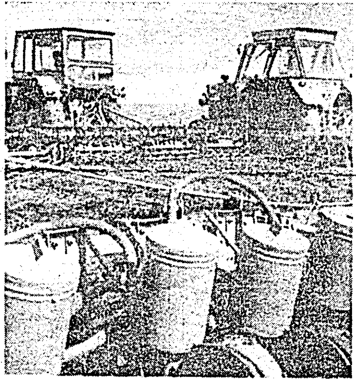
Pregătirea terenului, semănarea culturilor de primăvară — prioritatea priorităților în aceste zile pe ogoare.