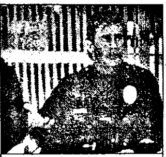
PRO7-21.15 Armă mortală 2- f. act. SUA 1992, cu Mel Gibson, Danny Glover, Joe Pesci

7.00 Reflectii 8.00 Vise africane 8.30 Curs de lb. franceză 9.05 Jurnal Canada