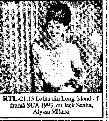
RTL-21.15 Lolita din Long Island - f. dramă SUA 1993, cu Jack Scalia, Alyssa Milano

Apărătorul 18.00 Riscă! - conc. tv. 18.30 Emisiuni regionale 19.00 Totul sau nimic - conc. tv.