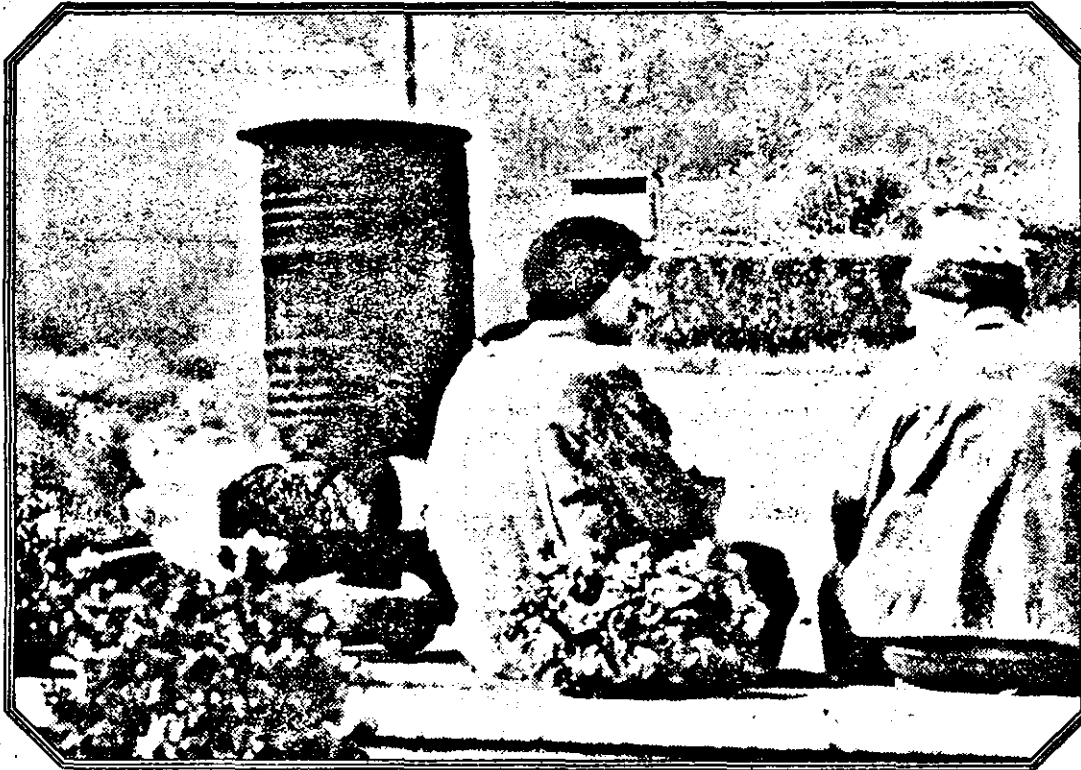
Șomaj la ... cazanul cu smoală.