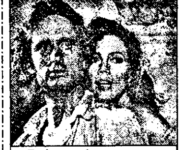
Budapesta 1-21.20 Romanta smaragdului - f. avent. SUA 1984, cu Michael Douglas, Kathleen Turner

7.15 Cei trei din Riptide - s.am. - rel. 8.00 Des. anim. 12.20 Pantera roz-s. 12.50 Parker Lewis, spaima școlii - s.am.: Să îmbătrânești frumos