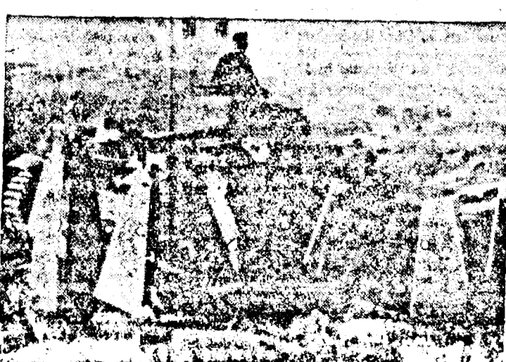
Trupuri germane urcând coama munților eleni.