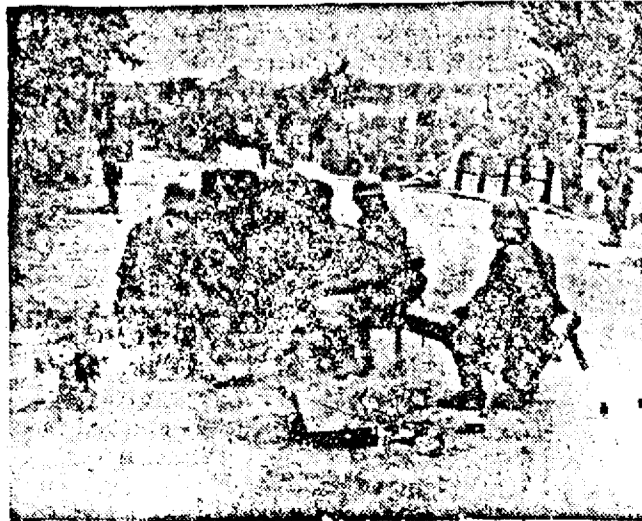
ÎN UCRAINA. Un tun anti-tanc german gata de luptă.

Spre revărsatul zorilor, locotenentul F., se întoarce victorios cu al său. Avionul său era nevătămat. Fapta sa intră în rândurile actelor de vitejie care au hotărât soarta luptelor din aceste vremuri mari.