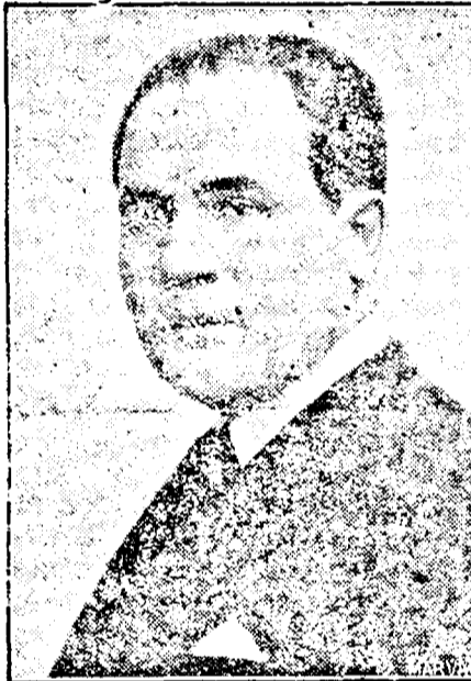
D. Mitită Constantinescu Ministrul Finanțelor

Problema unei bune și normale executări a prevederilor bugetare, după cerințele și nevoile actuale ale statului nostru constituie pentru ministrul Finanțelor, preocuparea centrală. De o bună distribuire a veniturilor generale ale statului și de o normală încasare a lor atârând în bună parte, continuarea — în ritm viu — a campaniei de înarmare și de investiții publice.