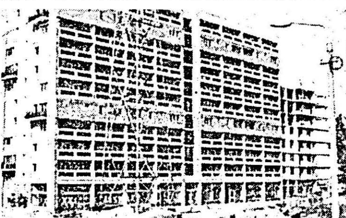
Un nou și modern bloc de locuințe în zona Pasaș Mică, la parterul cărui vor fi amenajate spații comerciale.

O situație mai deosebită creat în comuna Cermene de apele din canalul Tîr deversat peste coronamentul digurilor, înundînd peste ha de terenuri agricole cultivate. Dar și aici, cu răsp re, cu toată energia se nează pentru combaterea mărilor și pagubelor de de apele revărsate. De menea, în zona localității Zerind și Mișca sînt luate suri energice pentru a timpina noi inundații sac necîrî de teren, dat fiind ul că prognoza de pe Crîșul Negru, la punctul drometric Zerind, anunță pîșirea cotelor de inu cu 1,60 m. Se acționează importante forțe umane mijloace tehnice la conș rea și apărarea digurilor pe Crîșul Negru și ca Teuz.