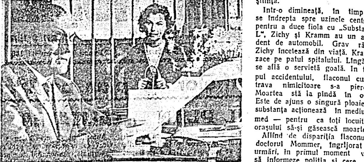
IN CLIȘEU: o secvență din filmul „Moartea are o față”.

Într-o dimineață, în timp ce se îndrepta spre uzinele centrale pentru a duce fiola cu „Substanța L”, Zichy și Kramm au un accident de automobil.