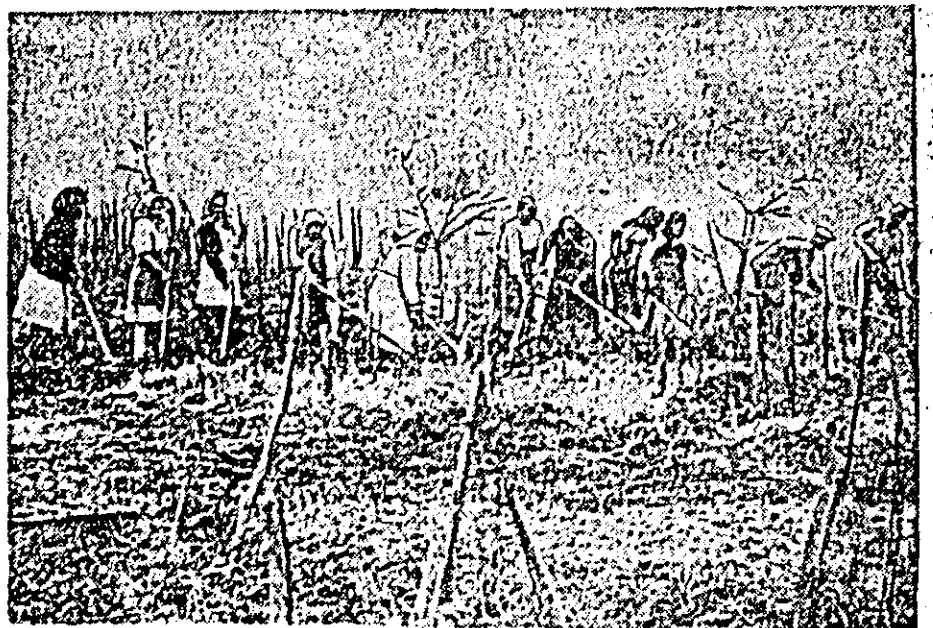
CLIȘEUL nostru reprezintă un aspect al muncii în via gospodăriei colective.