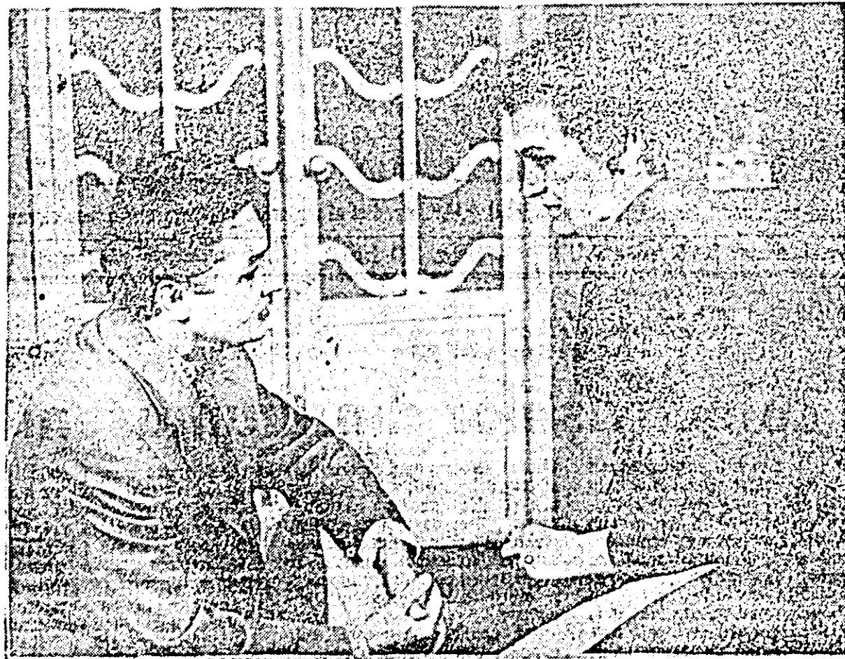
O scenă din piesă.

Orchestra populară a Filarmonicii de stat din Arad intră în aceste zile, în lungul turneu prin țară. Timp de două luni membrii orchestrei populare vor vizita localități și centre muncitorești din regiunile Oradea, Satu Mare, Cluj, Tg. Mureș, Suceava, Galați, Ploiești, București, Stalin și altele unde vor prezenta concerte de muzică populară. În repertoriul său orchestra populară are și noi culegeri de folclor din vatra folclorică a Aradului. I. UNGUREANU, coresp.