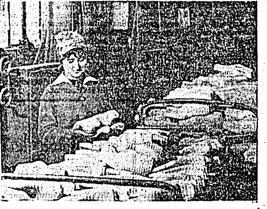
Calapoadele prind contur. Aspect de la fabrica „Libertatea Arad”.

urma stagnării apelor pe terenurile agricole în perioadele de primăvară, refacerea de canale ce deservesc unitățile agricole de stat și cooperativele în special, nu este întretinută în mod corespunzător. Din această cauză este necesar ca în perioada care urmează să fie întreprinsă o acțiune susținută de despotmolire și curățire de vegetație a întregii rețele de canale de pe teritoriul județului, astfel ca fiecare unitate agricolă de stat sau cooperativă să-și asigure funcționarea în condiții bune a rețelelor de canale ce-i aparțin.