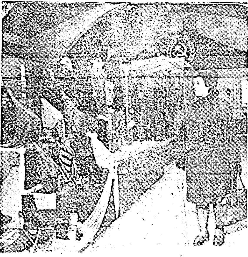
Aspect din expoziția „Căile de reducere a cheltuielilor materiale de producție” organizată de Comitetul județean Arad al P.C.R.

Faptul că în acest an alegerile U.T.C. se fac direct pe funcții creează posibilitatea ca tinerii să spună în mod deschis părerea asupra celor care vor fi aleși să-i conducă. Organele U.T.C. nou alese vor trebui să țină seama de propunerile și sugestiile tinerilor. Conținutul de idei, sensul semnificația majoră a documentelor de partid și de stat a fost în ultimul an au fost explicate în fața tineretului de către activiștii de partid și de stat profesori, ziaristi. În unele licee, săvîrșin, Lipova au luat la cercuri de dezbateri diferite probleme filozofice, economice, istorice, ceea ce creează înălțarea elevilor de a-și spu-