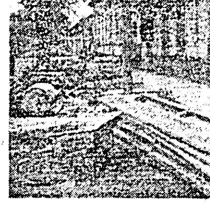
De anul trecut, pe strada Ecaterina Varga același aspect de șantier, deși se lucrează doar la „zile mari”.

Se spune că la nivelul municipiului ar exista o comisie care aprobă și îl dă avizul pentru spargerea pavajelor și efectuarea unor săpături. Aceasta ar avea și me-